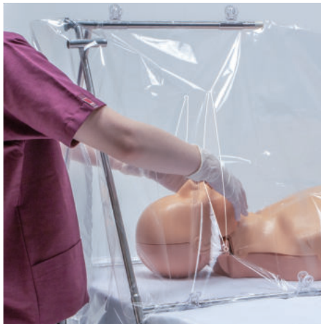
ビニールカバーは、両側面スリット、 尾側開口部からアプローチできます。