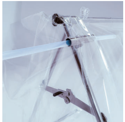
吸引チューブの挿入ポートがあります。